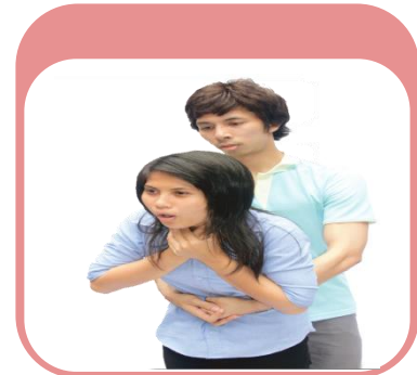
ภาวะทางเดินหายใจอุดตัน