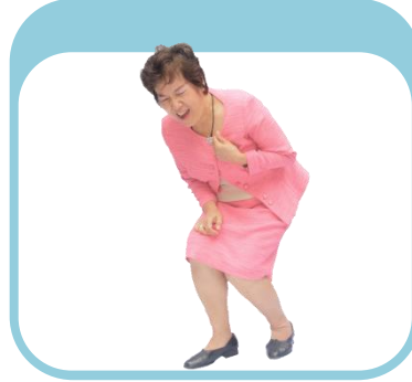
หัวใจวาย