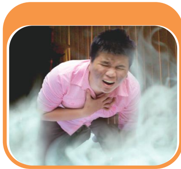
สำลักควันไฟ